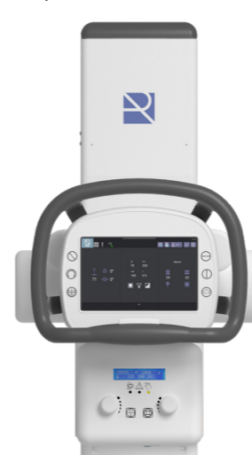
Panel de control Pantalla Táctil

Con autotracking vertical y horizontal junto con los valores digitales SID y angulación fácilmente visibles podrá agilizar el posicionamiento del paciente.