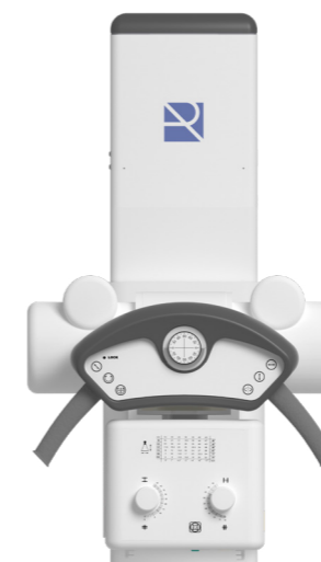
Panel de control Standard